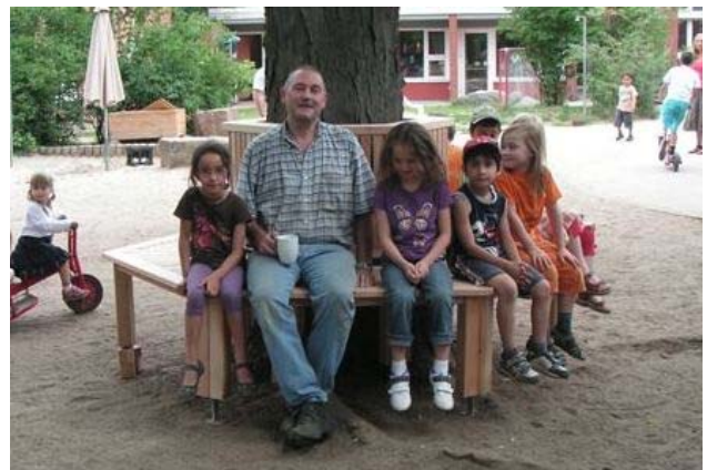
... und hinterher: Hier wird den Kindern und Erzieherinnen künftig ein wunderschönes Schattenplätzchen geboten

Am Boden steht jeweils ein Metallfuß, so dass die Feuchtigkeit des Bodens nicht von unten in das Holz ziehen kann. Wegen der herausragenden Wurzeln des Baumes - die vom TÜV als Sicherheitsmängel beanstandet wurden - stehen die die Füße der Baumbank derzeit noch in der Luft. Kurzfristig soll der Untergrund aufgefüllt werden und die Stolperwurzeln sind dann auch abgedeckt.