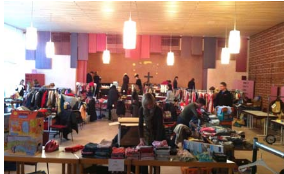
Impressionen vom Winterflohmarkt

Der diesjährige Winterflohmarkt am 18.02.2011 war wieder sehr erfolgreich. Im Gemeindesaal der Andreaskirche ausgerichtet brachte der Flohmarkt der Rüsselbande durch Standgebühren und durch den Verkauf von Kaffee und Kuchen Einnahmen in Höhe von 598,40 € .