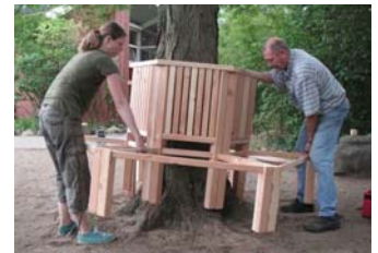
... beim Aufbau der neuen Bank

Am Boden steht jeweils ein Metallfuß, so dass die Feuchtigkeit des Bodens nicht von unten in das Holz ziehen kann. Wegen der herausragenden Wurzeln des Baumes - die vom TÜV als Sicherheitsmängel beanstandet wurden - stehen die die Füße der Baumbank derzeit noch in der Luft. Kurzfristig soll der Untergrund aufgefüllt werden und die Stolperwurzeln sind dann auch abgedeckt.