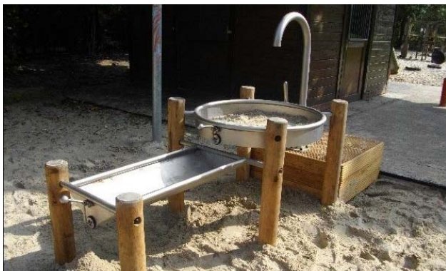
Beispiel: So könnten Elemente der Wasserspielanlage aussehen.

Der Förderverein Rüsselbande unterstützt seit Jahren die Sanierung des Außengeländes der Kita. Nach der aufwendigen Neubefestigung des Hügels mit dem Einbau der großen Findlinge, der Sanierung des Rutschenpodests und der Anschaffung des neuen Spielhäuschens im letzten Jahr ist die Realisierung einer Wasserspielanlage eines unser aktuellen Projekte. Konkrete Ideen für die gewünschten Elemente (Pumpe, Matschtisch, Wasserbecken mit Rückstaumöglichkeit sowie verschiedene Abflusrrinnen) gibt es bereits. Der Aufbau der Anlage soll mit einem Arbeitseinsatz, für den Kita-Arbeitsstunden angerechnet werden können, verbunden werden. Dies wird dann möglichst bald nach den Sommerferien stattfinden - auf ein anschließendes Grillfest zur Einweihung freuen wir uns schon jetzt!